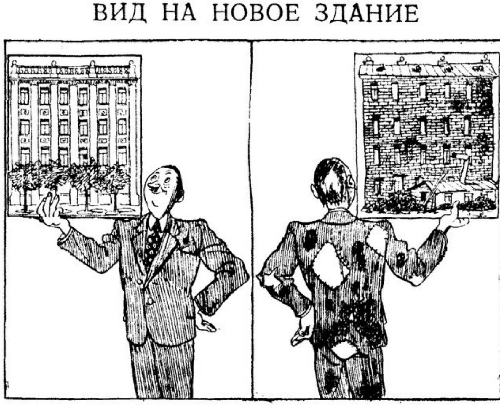
С фасада... и со двора. Рис. И. Семенов